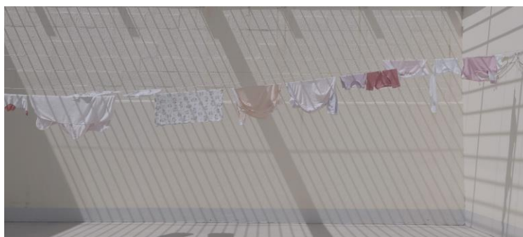
Fig. N.º 2 - pátio da ala materno-infantil. Frame do filme C(elas) , fotografia de Ursula Dart.

As imagens seguintes são referentes ao espaço da ala em que as mulheres, e nós da equipe de filmagem, passávamos mais tempo: o pátio, ou quintal, espaço da ala de acesso livre e onde as mulheres e as crianças realizavam várias das suas atividades, como lavar as roupas dos bebês, estendê-las, estar com as crianças nos carrinhos — como a maioria são bebês recém-nascidos, costumam ficar menos tempo nos colos das mães. Foi lá onde conversávamos sobre vários assuntos, desde a amamentação, o parto, a relação entre as mulheres da ala, até o assunto mais delicado de todos, que é a questão principal do filme: o que é ser melhor mãe? É aquela que, ao ter a criança, entrega-a para que seja de imediato criada do lado de fora, não a amamentando e, por conseguinte, não gerando um vínculo ainda maior entre mãe e bebê ou é melhor mãe a que tem a criança e decide amamentá-la, passando alguns meses com o bebê na ala e entregando-o em seguida, garantindo a amamentação mas quebrando esse vínculo fundamental de maneira ainda mais brusca e violenta?