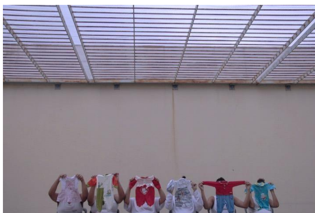
Fig. N.º 4 - mães ala materno-infantil sombreado. Frame do filme C(elas) , fotografia de Ursula Dart.

[...] formar as prisioneiras no “importante” papel feminino da domesticidade. Assim, um papel importante do movimento de reforma nas prisões para mulheres foi encorajar e inculcar papéis de gênero “apropriados”, como treinamento vocacional em culinária, costura e limpeza. Para acomodar esses objetivos, as casas reformatórias foram normalmente projetadas com cozinhas, salas de estar e até mesmo alguns viveiros para prisioneiras com bebês (Belknap apud Davis: 2017: 09).