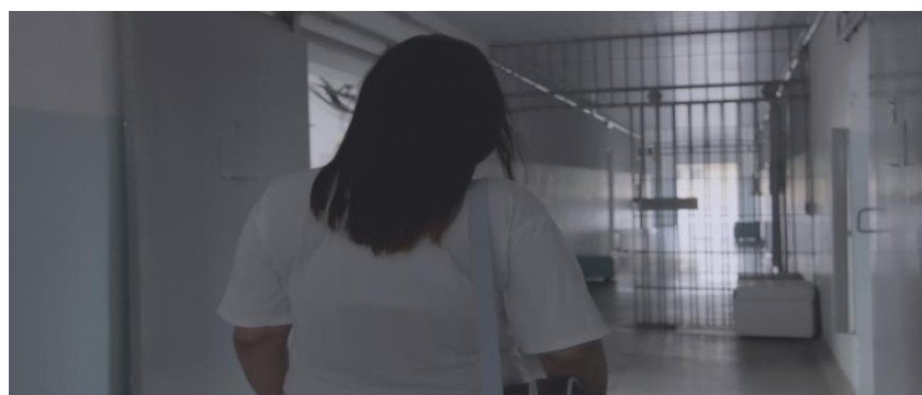
Fig. N.º 1 - corredor da ala materno-infantil. Frame do filme C(elas) . (Todas imagens apresentadas neste artigo são frames do filme e possuem, por isso, autorização para serem exibidas)

Nesta primeira imagem (Fig. 1) é possível visualizar o corredor da ala, no sentido contrário ao de sua entrada principal, que está no fim do corredor. Veem-se, também as entradas de acesso aos quartos: