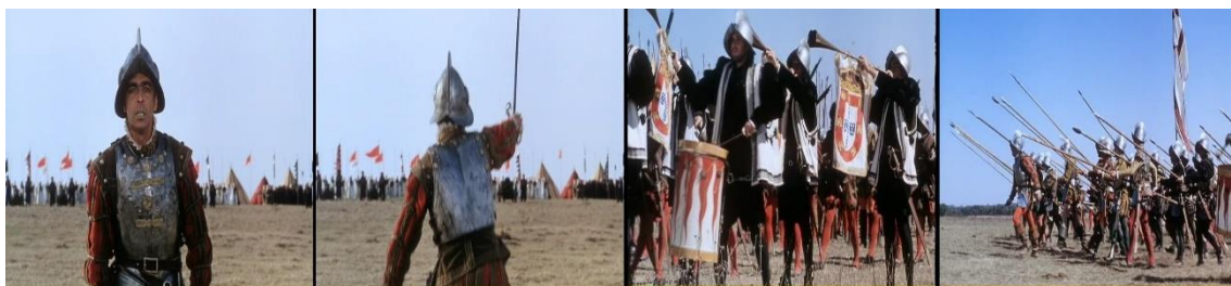
Figura 2: plano-sequência de Non ou a vã glória de mandar , de Manoel de Oliveira – 1h18'30”

É fato que Cabrita assume, neste filme, o papel de um cronista, bem ao estilo de romance histórico. Nesse sentido, até pelo tom de rememoração o episódio mais marcante na recapitulação feita pelo alferes é a Batalha de Alcácer Quibir, retratada pelo realizador de forma teatral e muito peculiar. Manoel de Oliveira, através da voz de alferes Cabrita, desconstrói a imagem de D. Sebastião que é mostrado nessa obra, não mais de forma messiânica, enquanto o desejado ou o encoberto. El Rei Sebastião retratado em Non ou a vã glória de mandar é uma figura antagônica que reflete a violência tão característica do sistema colonial, resultado de sua tirania que fere não só o inimigo, mas também a si próprio e aos que estão sob o seu comando. No filme, antes da sequência da guerra em Alcácer-Quibir, os conselheiros tentam dissuadir o rei da ideia da batalha, já que os adversários apresentaram uma proposta pacífica de resolução do conflito. Entretanto, D. Sebastião, “senhor de sua vontade” como diz uma personagem no filme, insiste em ir à guerra, conduzindo seu exército para a morte, ao lado dos soldados alemães, italianos e espanhóis. O capitão Alexandre Moreira, interpretado também por Luís Miguel Cintra dirige-se ao exército português pedindo que testemunhassem como se apeava para morrer, pois não havia ali, naquele momento, qualquer outra opção. Essa postura reforça o destino ao qual o país estava fadado.