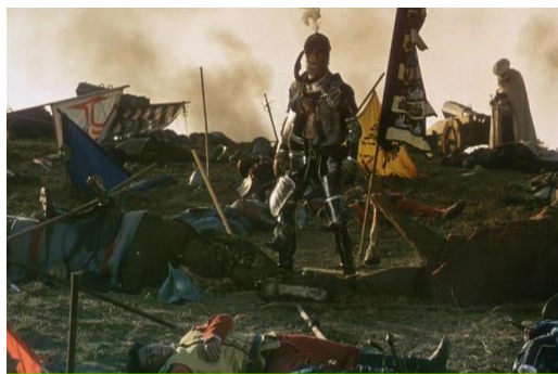
Figura 3: plano de Non ou a vã glória de mandar , de Manoel de Oliveira – 1h34'15”

Após a batalha, quando os mouros já conduziam os prisioneiros ao cárcere, levanta-se no campo onde jazem os mortos, um soldado português já à beira da morte, que do centro da derrota, declama as palavras de Vieira sobre a terrível palavra que é o NON. Essa figura, já envelhecida encara a essência crítica desse filme que conduz ao título da película. Este homem visivelmente remete o espectador à imagem icônica do Velho do Restelo camoniano e sua incisiva crítica à vã glória de mandar, ao mesmo tempo que entoas as palavras de Vieira sobre a fatalidade de um NON, cíclico e predestinado à sua essência de derrota e perda. Ali, na batalha de Alcácer-Quibir, Portugal completa mais um ciclo de lutas inglórias, mais uma tentativa vã de conquista.