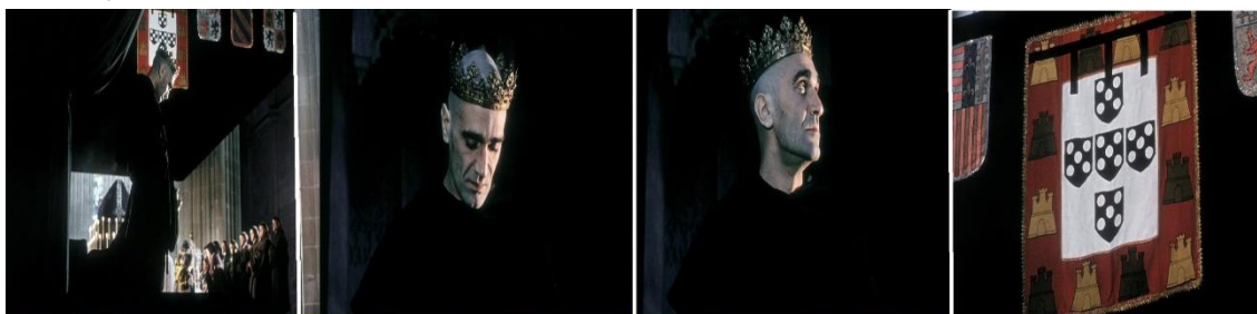
Figura 1: plano sequência de Non ou a vã glória de mandar , de Manoel de Oliveira– 39’50”

Os soldados ainda escutam o alferes contar sobre a tentativa de unificar os reinos de Portugal e Espanha, não só pela guerra, mas também pelo casamento. Essa intenção de unificação dos reinos e ampliação do território é, também, frustrada, uma vez que o príncipe, filho de D. João II, morre em um banal acidente a cavalo. A morte do herdeiro do reino – que encarna a união dos reinos da península – é vista como uma fatalidade que faz cumprir a vontade do destino, deixando Portugal fadado a mais uma derrota. O plano que mostra a figura de D. João II no funeral do filho representa simbolicamente essa sensação de desolamento em que mergulha a esperança da unificação dos reinos, unificação esta que não se concretiza nem pela guerra, nem pela paz. O rei mostra-se profundamente mergulhado em um silêncio fúnebre, reforçado pela imagem de seu rosto isolado em um plano no qual sua veste negra mistura-se às sombras do espaço cênico e o homem em luto mira, com decepção, o estandarte do reino