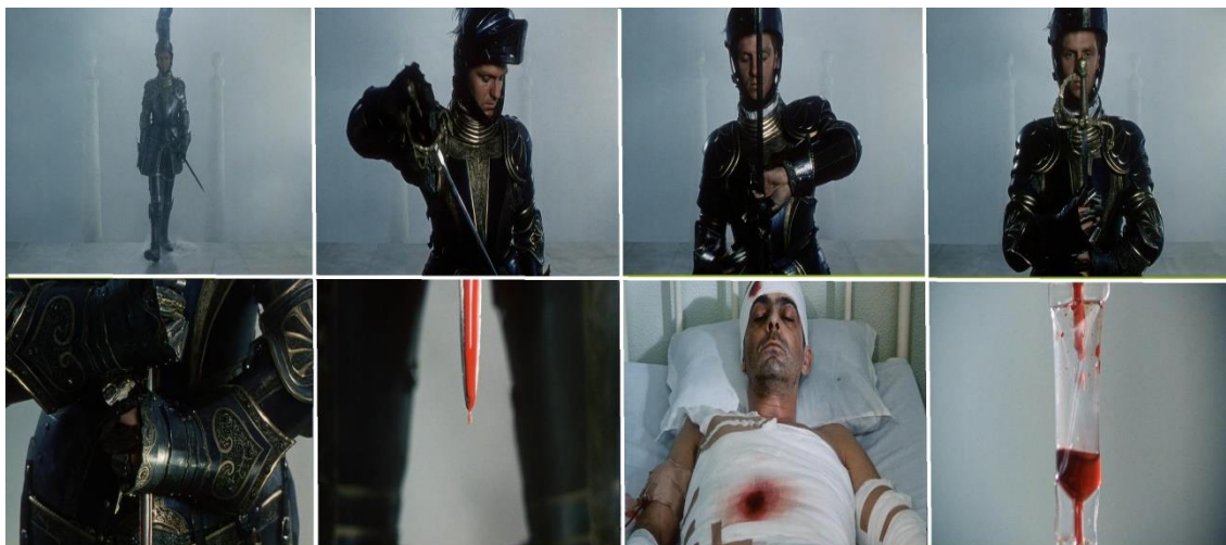
Figura 4: sequência de planos do filme Non ou a vã glória de mandar, de Manoel de Oliveira – 1h47'02”

O plano narrativo que acontece em África, baseia-se quase que totalmente na força da palavra, uma vez que as ações se limitam à movimentação dos soldados no jipe e às histórias recontadas pelo alferes. O único momento em que o grupo realmente se envolve em uma ação é quando a tropa é convocada a uma missão no meio da selva e tem um embate com os inimigos. No embate derradeiro, o alferes é atingido pelas armas inimigas, o que resultará em sua morte. Na sequência final, vê-se o grupo terrivelmente ferido em uma ala hospitalar a observar as últimas horas do alferes, agonizando em seu leito durante muito tempo, até que finalmente morre.